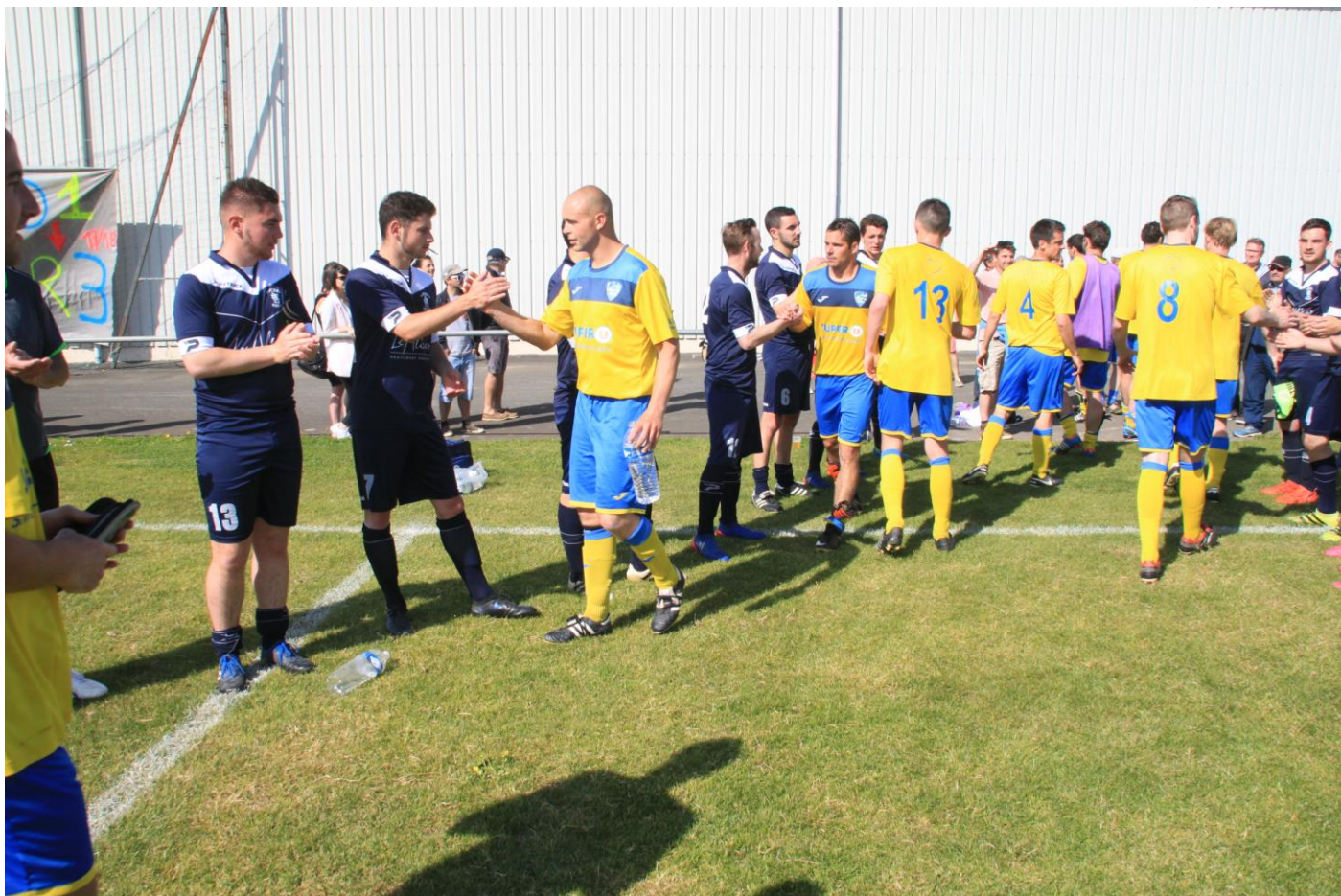
HAIE D'HONNEUR AUX CHAMPIONS DU GROUPE