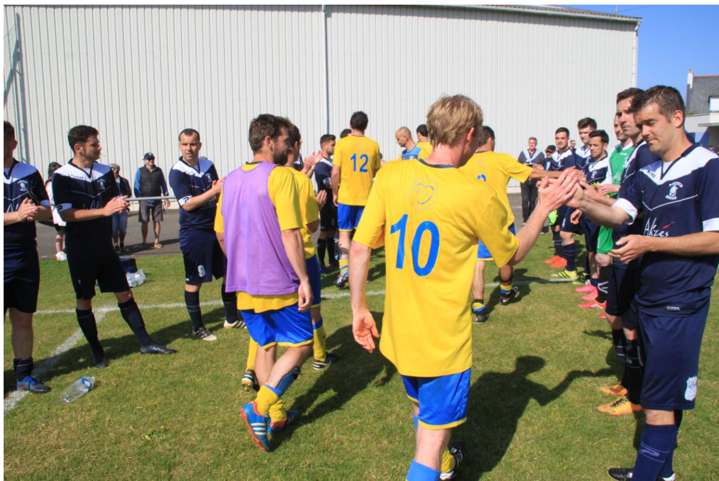
HAIE D'HONNEUR AUX CHAMPIONS DU GROUPE