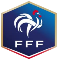
TABLEAU ELIMINATOIRE COUPE U13 G FUTSAL SAISON 2024-2025