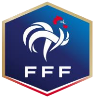
TABLEAU ELIMINATOIRE COUPE U15F FUTSAL SAISON 2024-2025