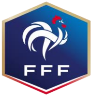
TABLEAU ELIMINATOIRE COUPE U15 G FUTSAL SAISON 2024-2025