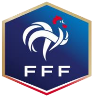
TABLEAU ELIMINATOIRE COUPE U11 F FUTSAL SAISON 2024-2025