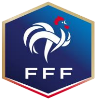
TABLEAU ELIMINATOIRE COUPE U11 G FUTSAL SAISON 2024-2025