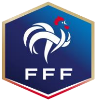
TABLEAU ELIMINATOIRE COUPE U13 F FUTSAL SAISON 2024-2025