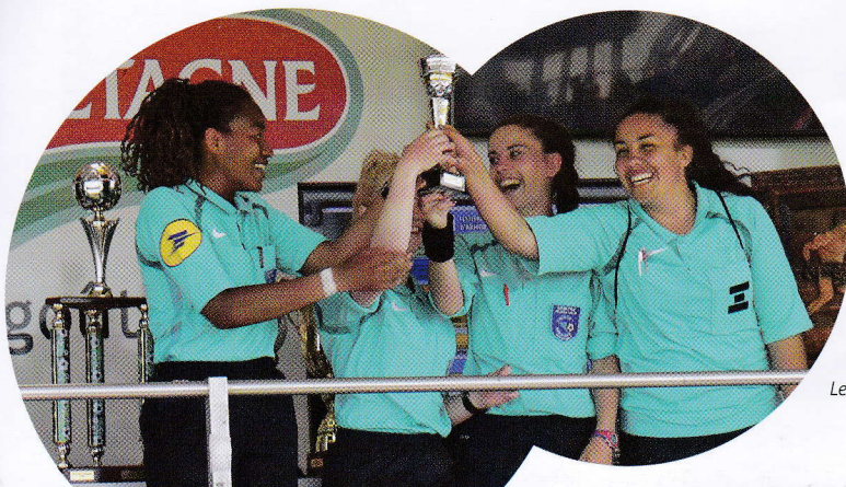
Les arbitres féminins du Festival d'Armor 2018